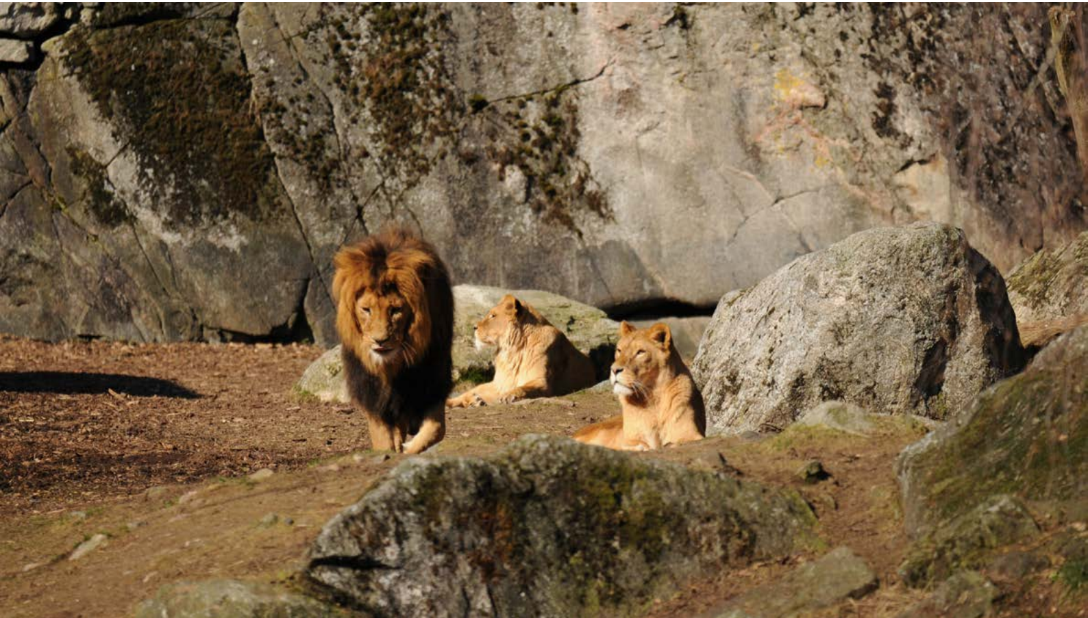
Definitivt känt som flockdjur, men det finns ju fler kattdjur som är det...