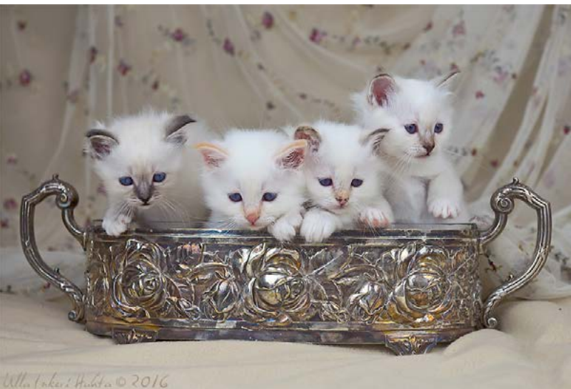
mars 2016