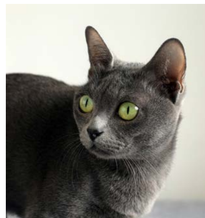
NW SC S*Mästertassen Nadee DVM

Grattis till alla fina och fantastiska missar och deras mattar och/eller hussar!