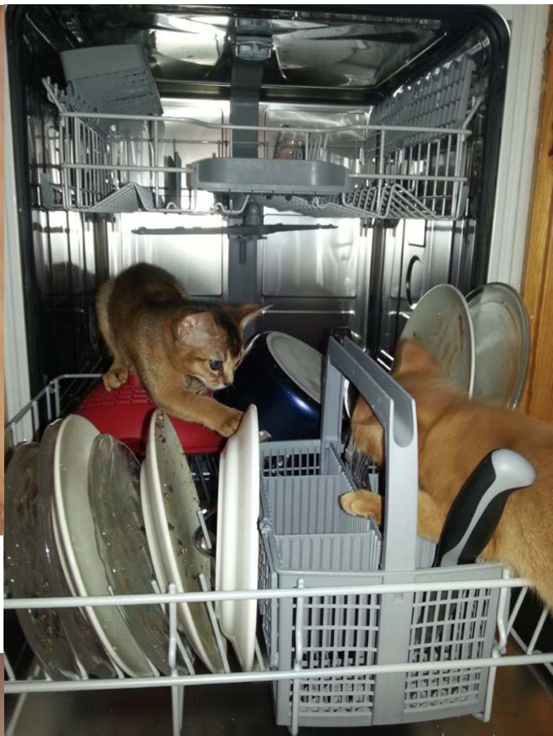
Ah vaddå, får inte vi vara här? Det är ju jätteskoj. Skimmerdal's Elton och Elvis hjälper till med disken.