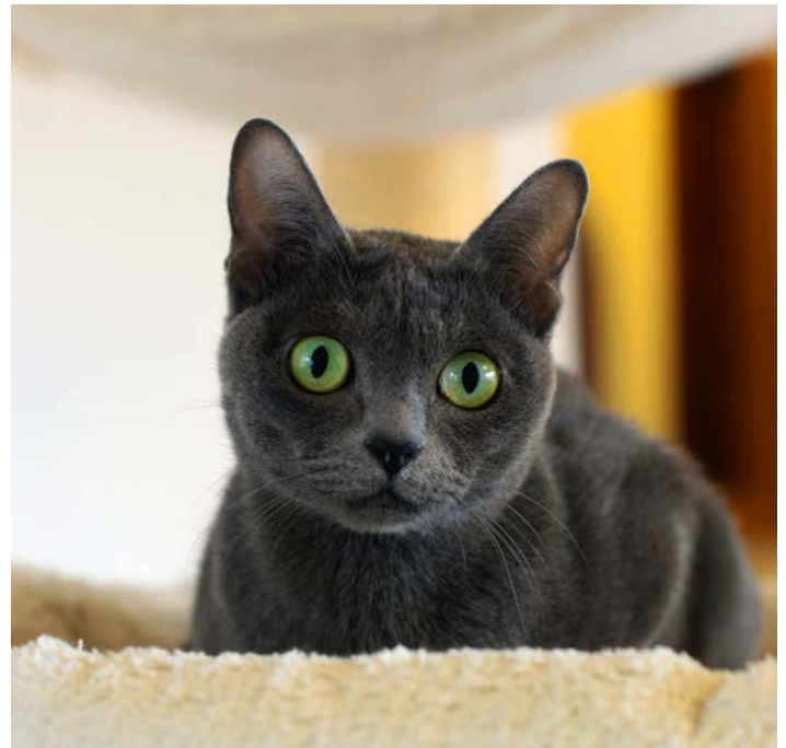
NW SC S*Mästertassen Nadee DVM