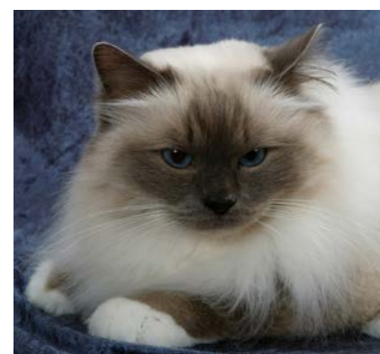
SP GIC S*Nebulosan's Caffra Marula DVM Fotograf: Tomas Lindgren 2011