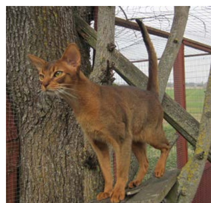
GIC S*Aucuparia's Byzantion