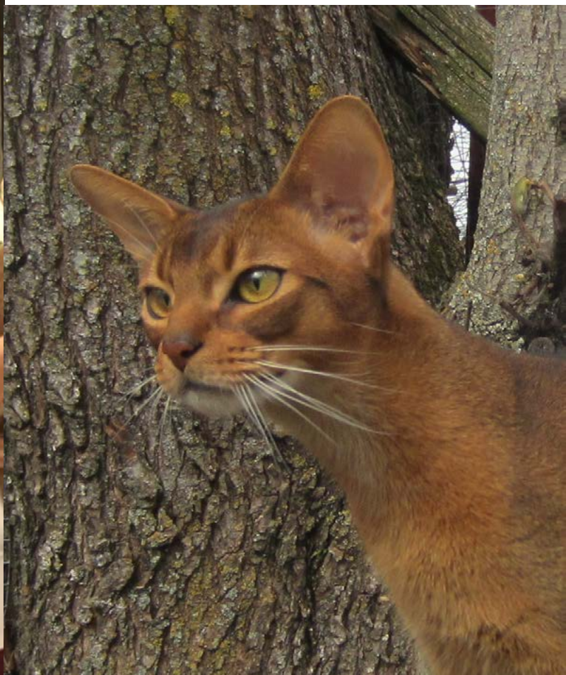
Youko Faeton JW, blev också Mediterranean Winner alldeles nyss 2016! GIC S* Aucuparia's Byzantion