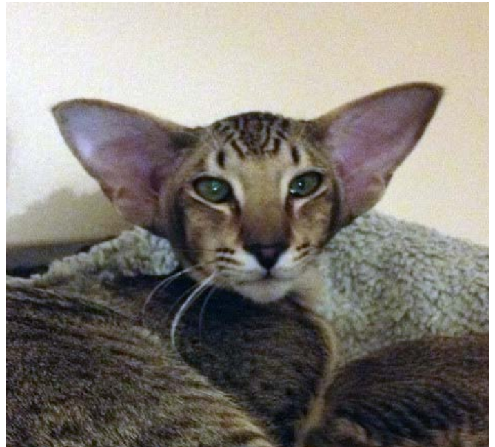
NW SC UA*Oristyle Cappelano JW