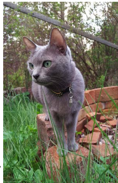
Minoe ute i en av våra kattgårdar

Ha en fin vår och ta många fina foton på era missar i vårsolen!