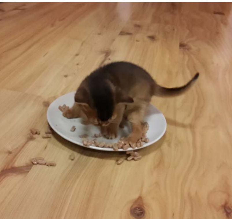
Det smakar faktiskt bättre så här, att det är skoj alltså. S*Skimmerdal's Happy Harmony 5 veckor visar fint bordsklick.