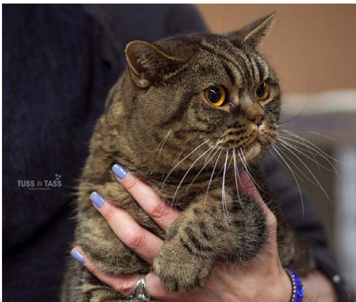
SP IC S*Applecat Roland DSM