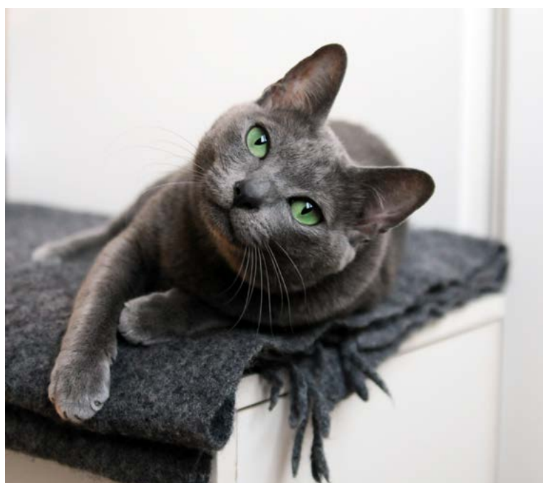
SP SC S* Mästertassen Minoe