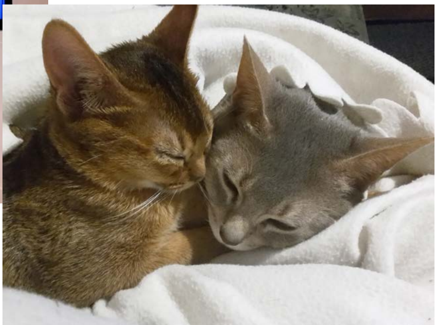
Och så behöver vi sova lite sen... IC S*Primuz-Zezam Ozzcar myser med sin dotter S*Skimmerdal's Happy Harmony.