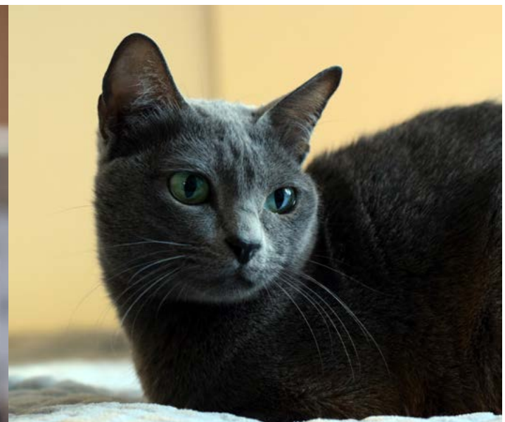
SP SC Quartus Shantung Louwin DSM