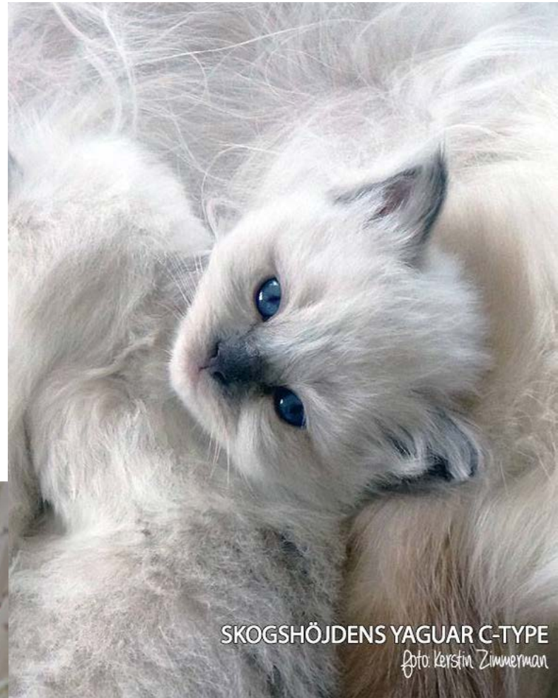
SKOGSHÖJDENS YAGUAR C-TYPE

En nyhet till. I slutet av maj kommer Tottes kronprins att flytta hem till oss. Det är en blåmaskad liten grabb från Kerstin Zimmermans uppfödning i Köping, Skogshöjdens Jaguar C-Type. Hoppas förstås att han ska passa bra in i gruppen och få fina mysiga ungar med mina töser. Just nu är han snart 8 veckor och är en urcharmig liten herre. Är man partisk eller ? :)