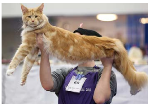
Ch SE*KobbaCat's Baloo

Grattis till alla fina och fantastiska missar och deras mattar och/eller hussar!